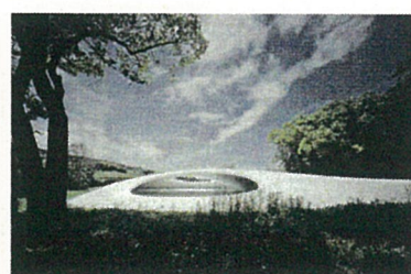
豊島/香川/西沢立衛