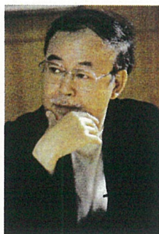
2000年「せんだいメディアテーク」