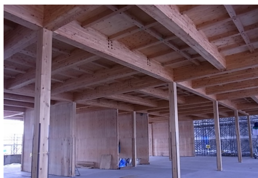
中断面集成材と住宅用梁受金物による6mグリッド 2階床組+高倍率耐力壁