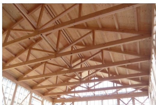
流通製材と住宅用プレカットによる12mスパン 山形トラス