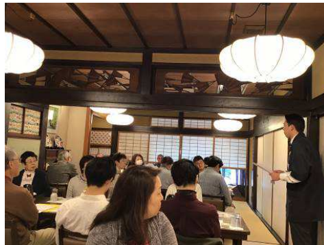
がんこ平野郷屋敷内：店長のお話

2019年春に女性委員会でご企画した「がんこ平野郷屋敷」(旧辻元家住宅)の見学会&「平野」のまちあるきは、会員の皆様にご好評いただきました。