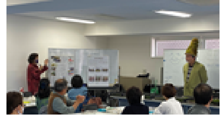
地球温暖化帽子をかぶる講師

苔があれば部屋の空気も浄化されるとのこと。皆が自分の苔テラリウムを持てば周りの空気が綺麗になり、さらには地球温暖化防止に繋がっていくことを、楽しく実感できた2時間あまりでした。（山本 尚子）