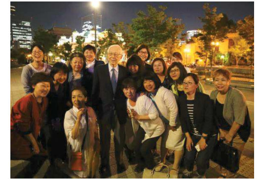
講演会終了後の槇先生を囲んで