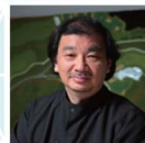
建築家 坂 茂 SHIGERU BAN