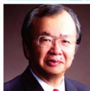
関西大学教授 河田 恵昭 YOSHIAKI KAWATA