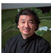
建築家 坂 茂 SHIGERU BAN

1981 工芸財団より、 第九回国井喜太郎産業工芸賞受賞 1984 アメリカ・インダストリアル デザイン誌より RESIDENTIAL FURNISHING 最優秀賞 受賞 1985 毎日デザイン賞 受賞 1990 ミラノにて個展/スペインにて、 デルタ・デ・オロ賞 金賞受賞 1993 ウィーン国立応用美術大学 客員教授を務める 2004 日本グッドデザイン賞審査委員 を務める(2004、2005、2006) 2004 大阪芸術大学教授 デザイン学科長就任 2011 イタリア Compasso d'Oro 賞受賞